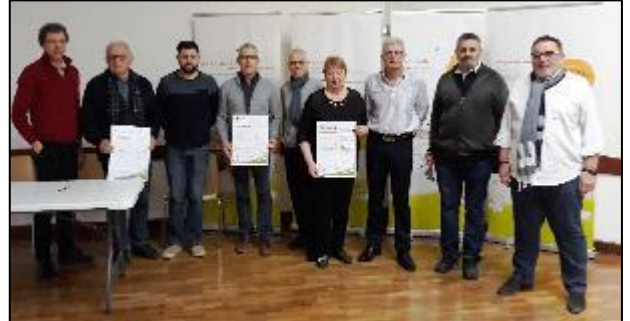
Signature de la charte par les communes de Loyettes, Nivigne-et-Suran et Saint-Denis-en-Bugey