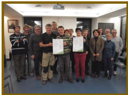
Signature de la commune de Saint-André-d'Apchon

30 novembre 2016 : signature de la commune de Cervens dans le cadre du contrat de territoire du sud-ouest lémanique.