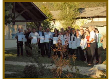
Signature de la commune de Mionnay (en haut) et des 26 communes du Bugey Sud (en bas)