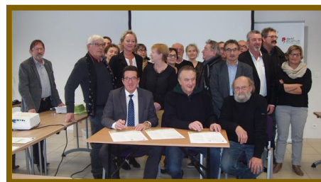
Signature de 22 communes de la Communauté de communes Hermitage-Tournois

15 décembre 2016 : signature de 14 communes de l'Ardèche (Boucieu-le-Roi, Cheminas, Colombier-le-Jeune, Colombier-le-Vieux, Glun, Lempis, Mauves, Plats, Saint-Barthélémy-le-Plain, Saint-Félicien, Saint-Jean-de-Muzols, Secheras, Tournon-sur-Rhône, Vion) et de 8 communes de la Drôme (Beaumont-Montoux, Chanos-Curson, Chantemerle-les-Blés, Crozes-Hermitage, Erôme, Gervans, Mercuriol-Veunes, Pont-de-l'Isère) aux côtés de la Communauté de communes Hermitage-Tournois, de la FRAPNA et de la FREDON.