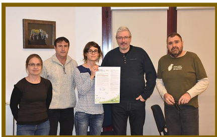
Signature de la commune de Mercuer