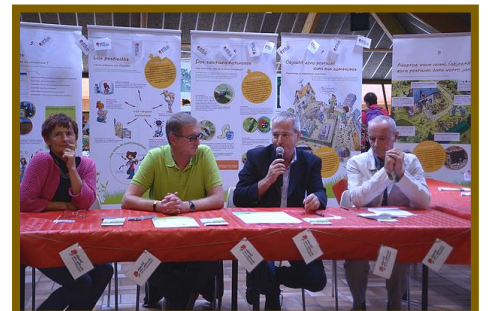
Signature de la commune d'Allinges

11 octobre 2016 : signature de la commune de Passy.